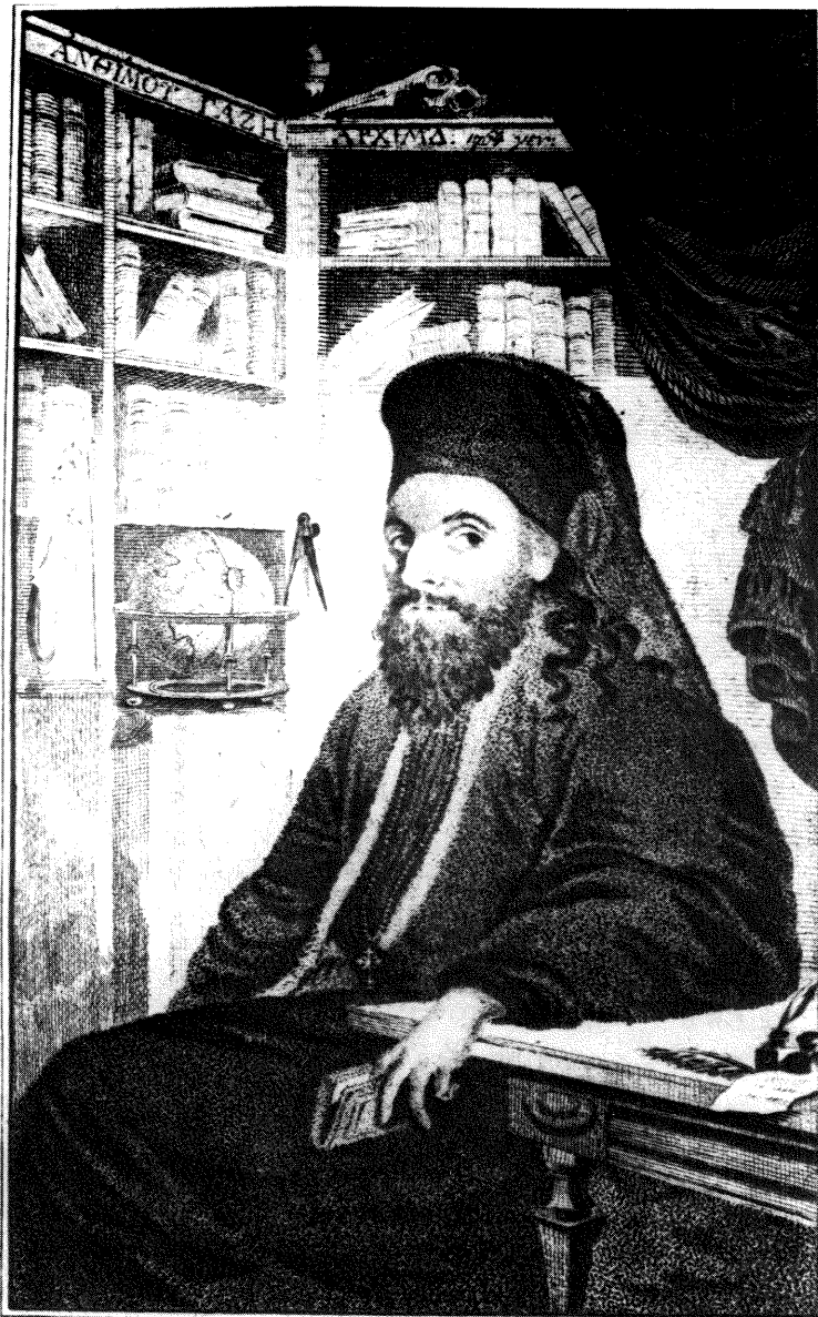
Εικόνα: παράφραση του Ανθίμου Γαζή.

" — — — — — άσολις Δ', όθλα' τό μή καλόν Ξύνεσι λάμας χαρίν. Σοφ. Αντ. σ' 577.