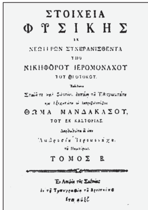
Η σελίδα τίτλου του βιβλίου του Νικηφόρου Θεοτόκη, Στοιχεία Φυσικής , τόμ. Β', Λειψία 1767