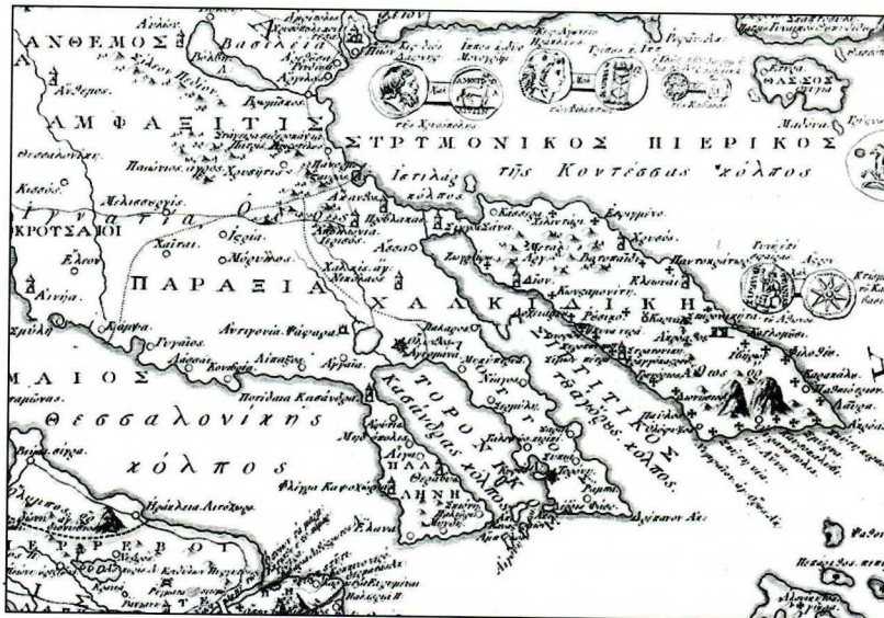
Η Χαλκιδική στον χάρτη της αρχαίας Ελλάδος του Delisle πάνω και στην «Χάρτα της Ελλάδος» κάτω με την ταυτόσημη μορφολογία.